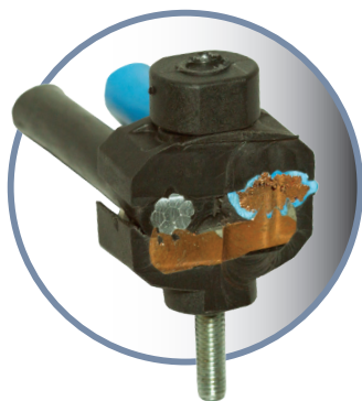
Demonstração em corte do KPB

Os conectores da família KPB foram desenvolvidos para atender as conexões do ramal de entrada do cliente entre condutores rígidos ou flexíveis (nus ou isolados) em qualquer tipo de configuração, ou seja, o operacional não necessita mais identificar o lado do conector para realizar a aplicação, pois ambos os lados do produto aplicam estes condutores, definindo o conceito universal do produto. Destaca-se entre as principais características da família KPB , o projeto inovador do balanço no barramento que realiza o efeito mola na conexão e a maior abrangência do range de aplicação de seus modelos que reduz a quantidade de itens a serem selecionados pelo operacional, reduzindo significativamente o índice de falhas na rede por erro de seleção. A família KPB acomoda range de cabos na faixa de 4mm 2 a 240mm 2 .