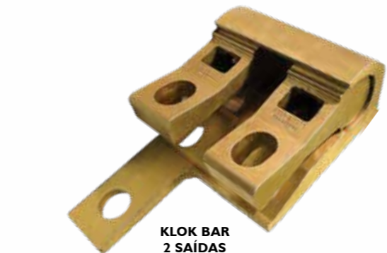
KLOK BAR 2 SAÍDAS