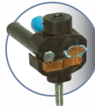
Demonstração em corte do KPB

Os conectores da família KPB foram desenvolvidos para atender as conexões do ramal de entrada do cliente entre condutores rígidos ou flexíveis (nus ou isolados) em qualquer tipo de configuração, ou seja, o operacional não necessita mais identificar o lado do conector para realizar a aplicação, pois ambos os lados do produto aplicam estes condutores, definindo o conceito universal do produto. Destaca-se entre as principais características da família KPB , o projeto inovador do balanço no barramento que realiza o efeito mola na conexão e a maior abrangência do range de aplicação de seus modelos que reduz a quantidade de itens a serem selecionados pelo operacional, reduzindo significativamente o índice de falhas na rede por erro de seleção. A família KPB acomoda range de cabos na faixa de 4mm 2 a 240mm 2 .